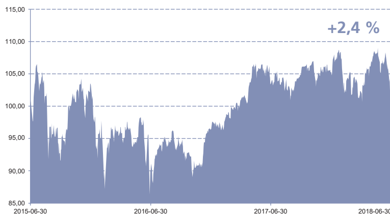
Fondo investicinio vieneto kainos 3 metų pokytis 2015 m. birželio 30 d. investicinio vieneto kaina prilyginta 100 sąlyginių vienetų